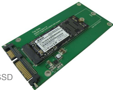
組裝 2260 M.2 SSD