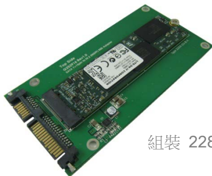
組裝 2280 M.2 SSD