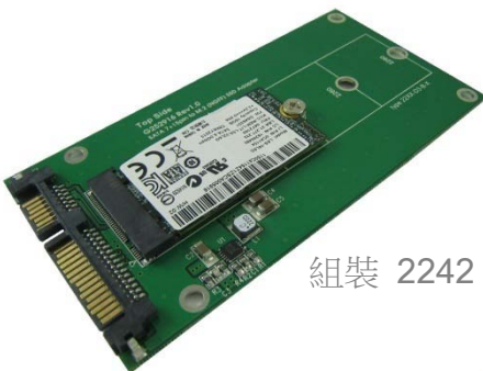
組裝 2242 M.2 SSD